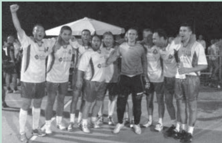
■ LA SQUADRA DI ONTAGNANO, vincitrice del Torneo dei Borghi di Gonars edizione estate 2013

Madonna, prima del tradizionale incontro pomeridiano presso la vicina sala civica, dove tutti gli intervenuti si sono intrattenuti fino a ora di cena. Il Circolo Insieme ha offerto a tutti la tradizionale bicchierata accom-