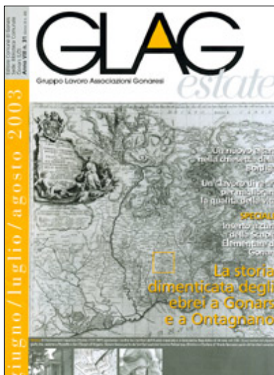
La copertina cartacea di questo numero di GLAG

Pubblicazione realizzata grazie al Gruppo di Lavoro Associazioni Gonaresi