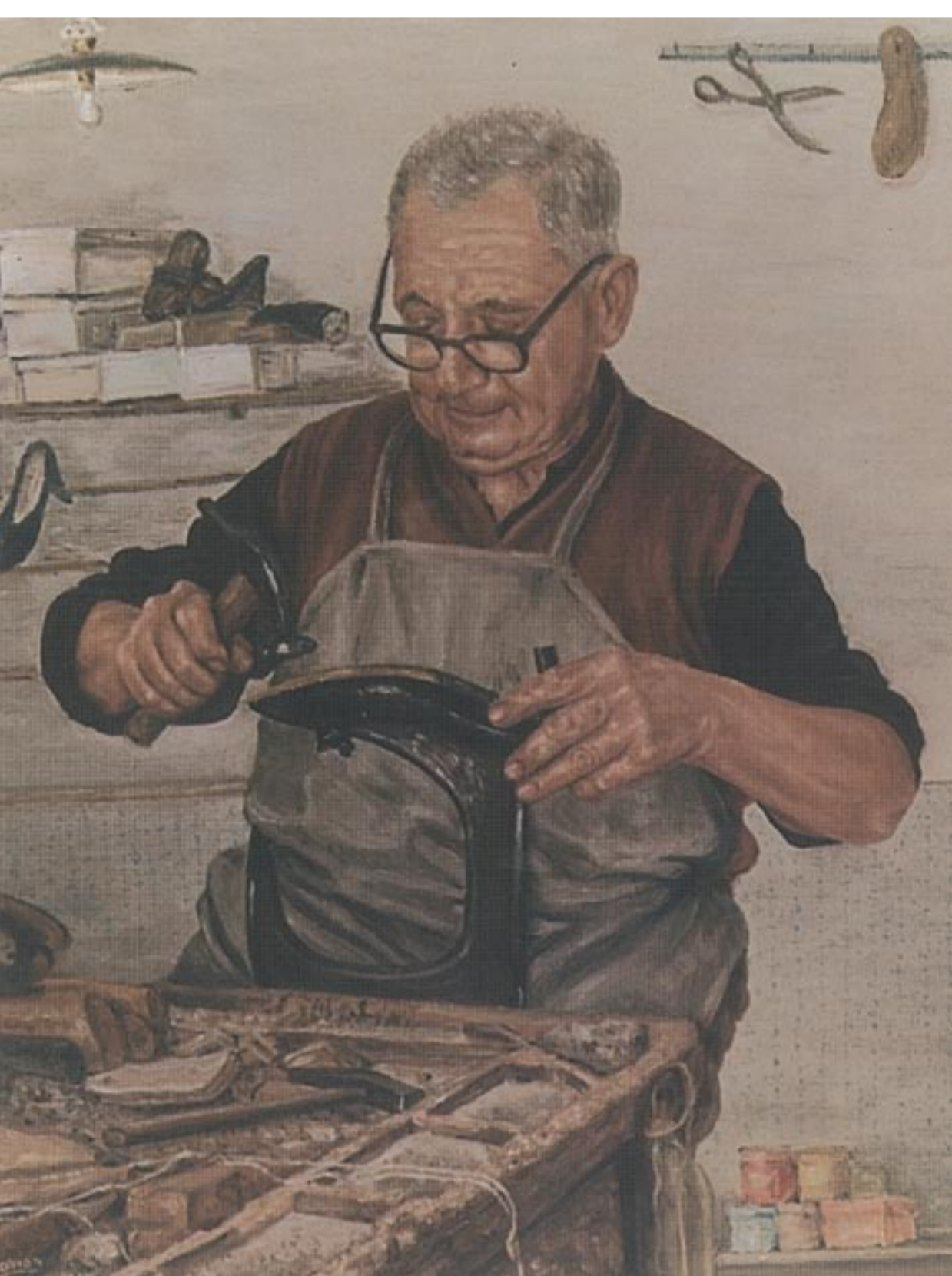
▲ Il calzolaio “Cintut” in un’opera di Aldo Tavian, pittore di Gonars Il cjalâr “Cintut” intune opare di Aldo Tavian, pitôr di Gonârs “Cintut” the cobbler in a painting by Gonars artist Aldo Tavian

Now only a few businesses survive, having specialized in the production of particular lines of shoes.