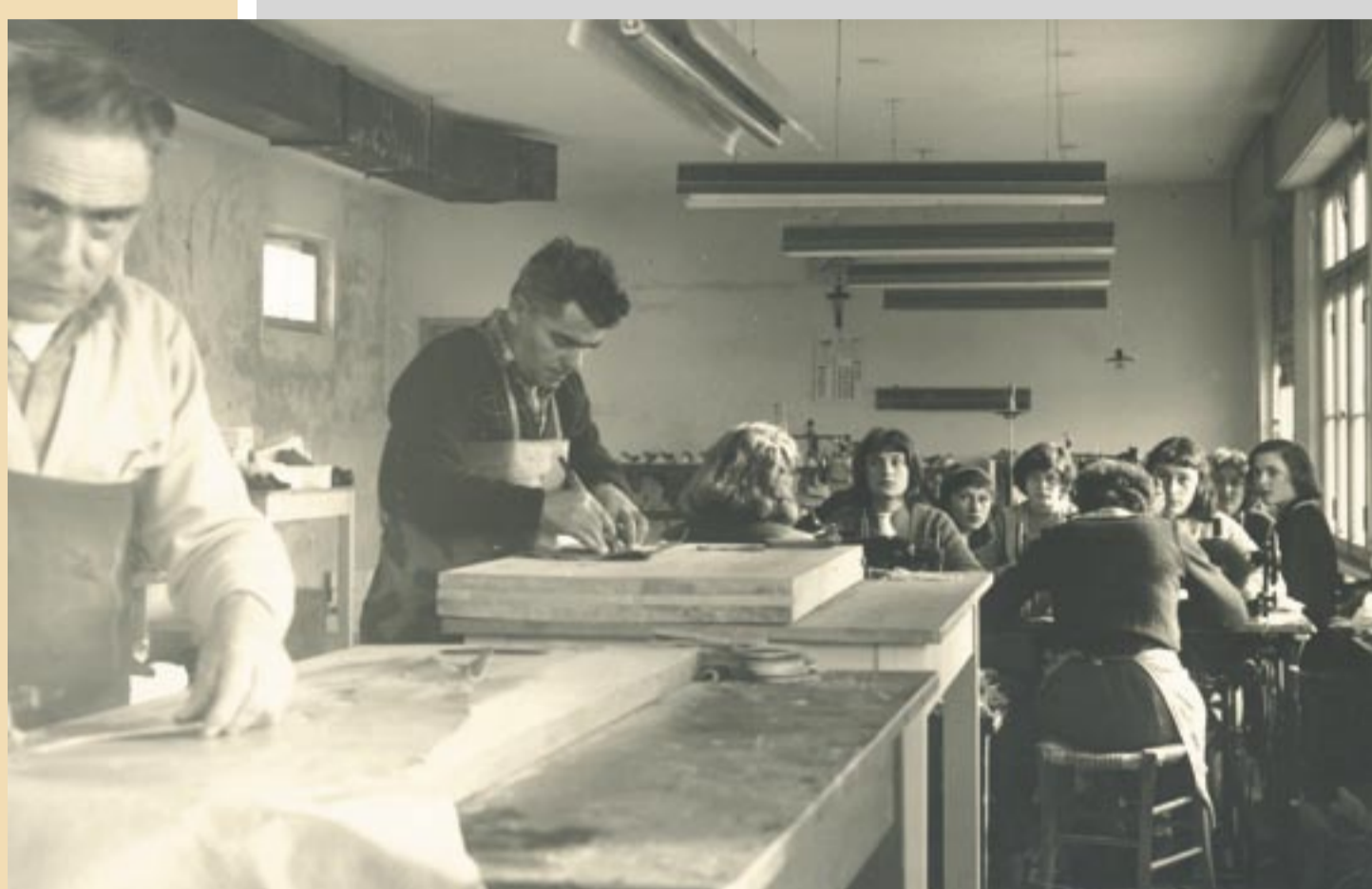
▲ Interno di un laboratorio, 1962 Dentri di un lavoratori, 1962 Interior of a workshop, 1962

Gonars is renowned for the production of shoes and slippers, which was its main economic activity during the past century. Its connection with shoe-making, however, goes back a very long time: a contract of apprenticeship dating from 1670 proves that shoe-making had already become an established tradition if young apprentices from other villages came here to learn their craft. In the 18th century shoe-making had taken the place of weaving as the main occupation of local